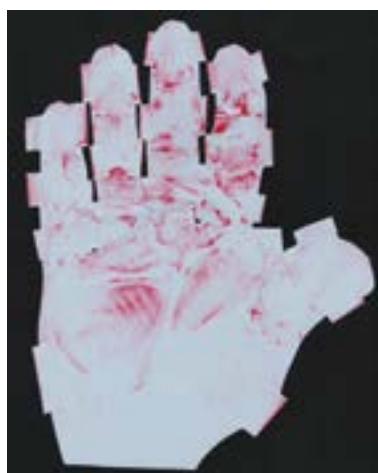
Отпечаток, полученный при тестировании инструмента серии SQ.line