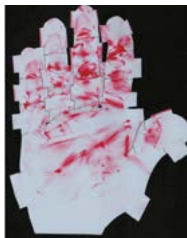
Отпечаток, полученный при тестировании инструмента от компании Synthes